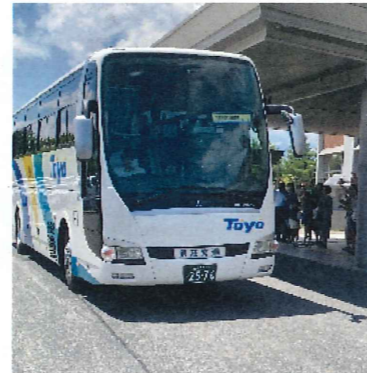
お見送りありがとうございました。